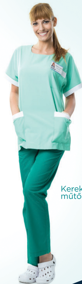
Kereknyakú műtős szett