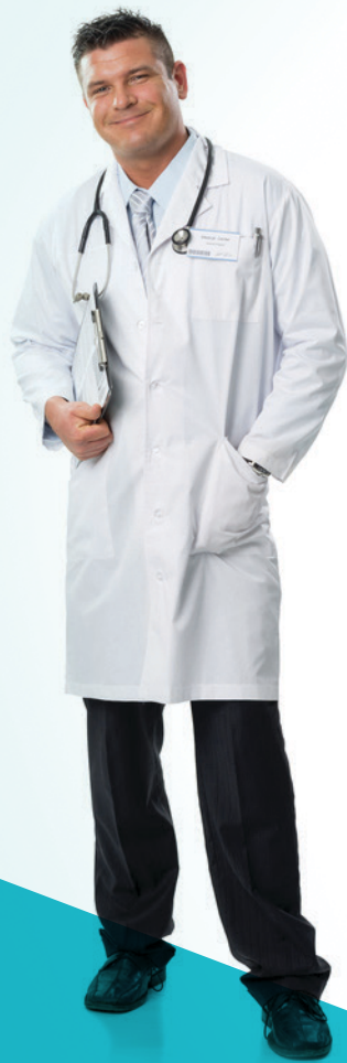
Hosszú férfi köpeny