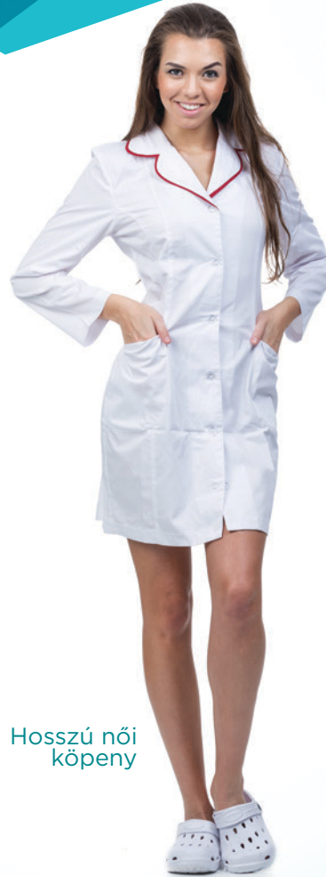
Hosszú női köpeny