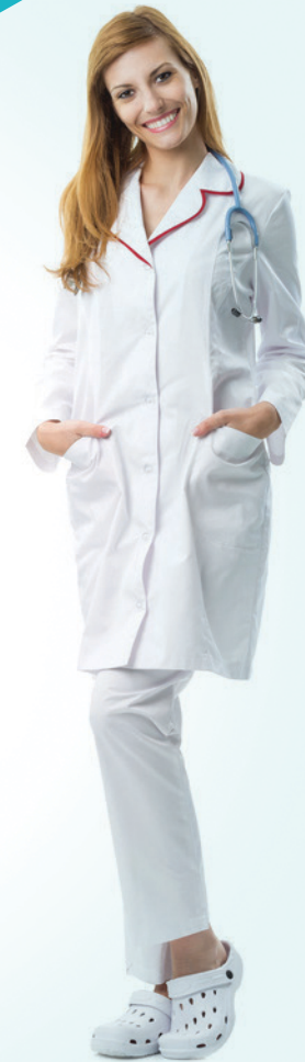
Hosszú női köpeny